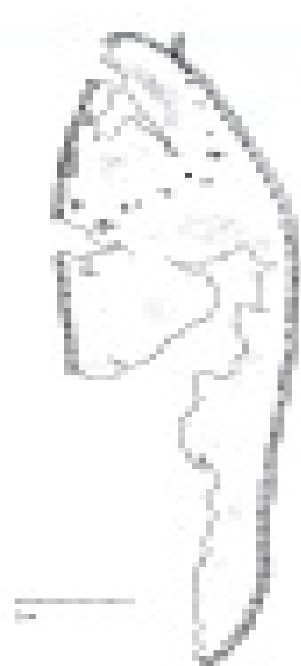
1 pav. Odinio pado liekanos Fig. 1. Remains of the leather sole

batviršio gerąją pusę į išorę. Vėliau nudilus tradiciškai labiausiai dylančioms pado vietoms, prisiūti du lopai – vienas priekyje, kitas kulno dalyje. Pastarasis lopas buvo beveik 1 cm platesnis už bato padą. Galima manyti, jog pado lopymas buvo atliktas neprofesionaliai. Lopas bato priekyje taip pat išpjautas netiksliai. Taisymo netvirtinant lopo prie pado kraštų būdas nėra meistriškas. Kaip rodo vėlesnio laikotarpio, XVI a. pab.–XVII a. pr., Vilniaus miesto Malūnų g. archeologinių kasinėjimų metu surastų