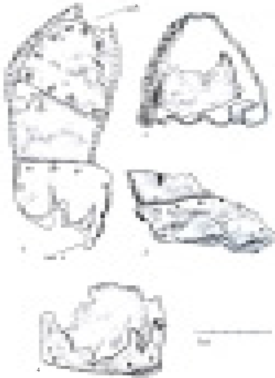
2 pav. 1 – vaikiško bato padas; 2 – pado su odiniu dirželiu liekanos; 3 – neaiškaus dirbinio fragmentas su lopu; 4 – lopo liekanos

Fig. 2. 1. The sole of an infant shoe; 2. Remains of the sole with leather strip; 3. The fragment of unknown leather artefact with a patch; 4. Remains of the patch